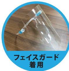
フェイスガード 着用