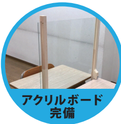
アクリルボード 完備