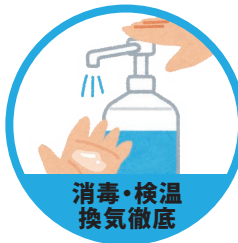
消毒・検温 換気徹底